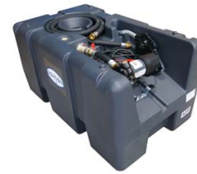
CUVE RAVITAILLEMENT 200L POMPE 12V 40L/M - 4M