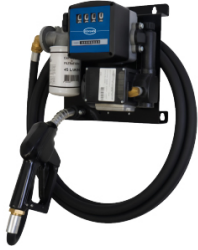
STATION FUEL ESSENTIEL+ 50L/M 230V - PISTOLET AUTOMATIQUE