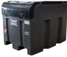
CUVE DE RAVITAILLEMENT 400L POMPE 12V 50L/MIN