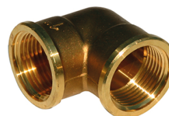
COUDE 90° LAITON 90L FF 1"