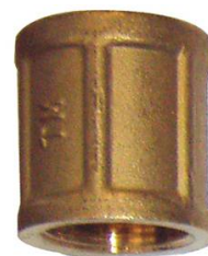
MANCHON LAITON FF 1"