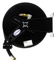
ENROULEUR ACIER POUR GASOIL EQUIPE FLEXIBLE 15M EN 1"