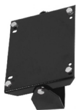
SUPPORT MURAL PIVOTANT POUR ENROULEUR ACIER