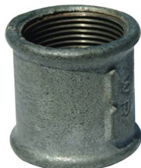
MANCHON DROITE & GAUCHE GALVA N°271 FF 1"