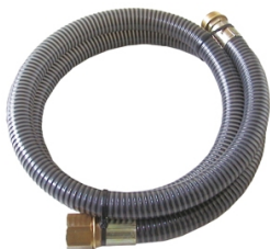
FLEXIBLE DE JONCTION Ø 25MM 2M AVEC RACCORD TOURNANT